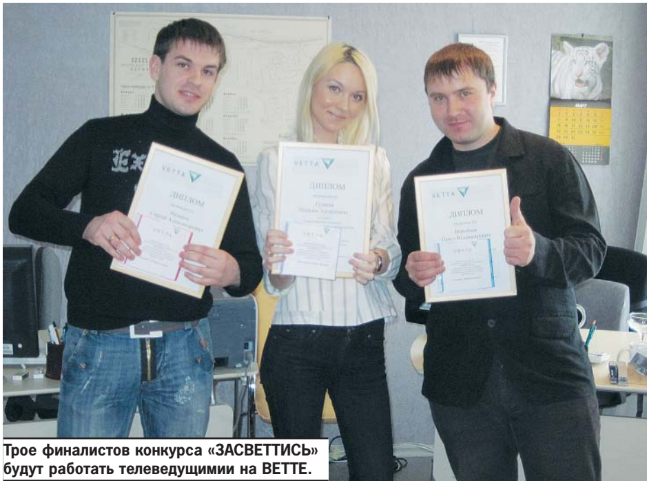
Трое финалистов конкурса «ЗАСВЕТИТЬСЯ» будут работать телеведущими на ВЕТТЕ.

О конкурсе «Засветтись», который проводила телекомпания ВЕТТА при поддержке Министерства культуры, молодежной политики и массовых коммуникаций Пермского края, говорил весь город. Попробовать себя в качестве ведущего решилось около 500 пермяков. Ребята отправляли свои резюме и фотографии на сайт www.vetta.tv . Это было похоже на сдачу экзамена на престижный вуз, но во второй этап смогли пройти только 30 талантливых, молодых, ярких и амбициозных девушек и парней. Тут-то и началось все самое сложное и интересное: ребятам нужно было записать пробы на студии. Волновались, стеснялись, краснели, забывали текст, но старались, и у многих получалось войти в образ настоящего телеведущего.